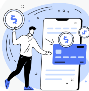
seus hábitos de consumo